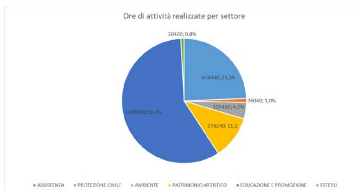
Graf.7 - Distribuzione delle ore realizzate per settore